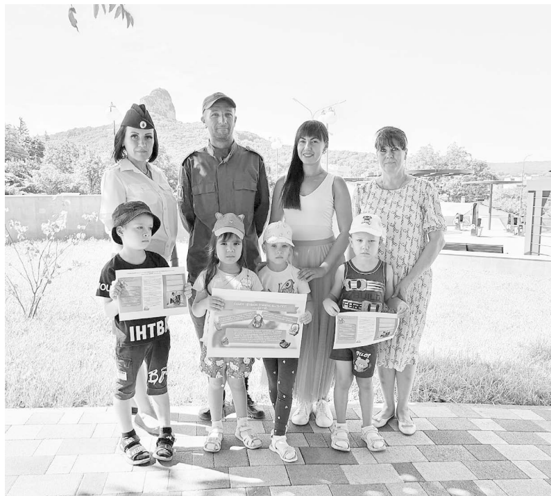
ОГИБДД ОМВД России по городу Железноводску

Госавтоинспекция напоминает, что перевозка детей младше 7 лет допускается только в автокресле. Перевозка несовершеннолетних в возрасте до 12 лет на переднем пассажирском сиденье легкового автомобиля также осуществляется только с использованием детских удерживающих устройств. Детское удерживающее устройство должно соответствовать весу и росту ребенка.