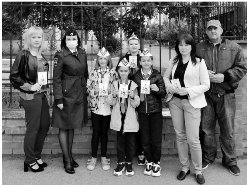
ОГИБДД ОМВД России по городу Железноводску

В ходе мероприятия автоинспекторы совместно с ЮИДовцами проводили беседы с участниками дорожного движения и раздавали им тематические памятки. Основное внимание уделили правилам езды на велосипеде, напомнив о необходимости использования защитной экипировки.