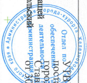
Схема расположения территории жилой застройки, подлежащей комплексному развитию, расположенной по адресу: Ставропольский край, город Железноводск, улица Чапаева, 50-52

УТВЕРЖДЕНА Постановлением администрации города-курорта Железноводска 30 сентября 2021 г. № 721