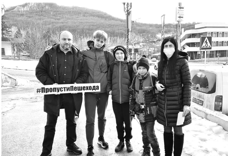
ОГИБДД ОМВД России по городу Железноводску

Полицейские и общественники надеются, что водители и пешеходы будут взаимно вежливы не только в период проведения таких мероприятий, и призывают родителей прикрепить на одежду детей световозвращающие элементы.