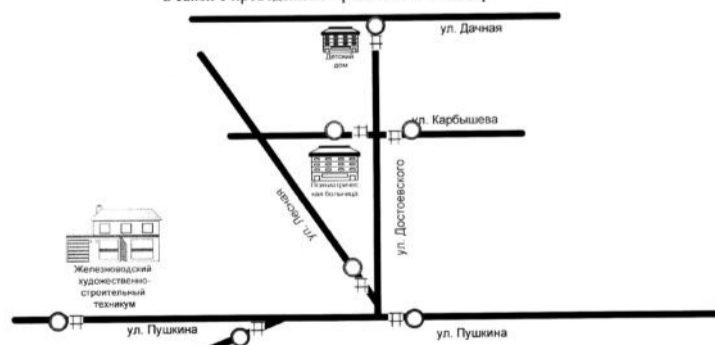
СХЕМА расстановки информационных панно, металлических ограждений и дорожных знаков, обеспечивающих безопасность движения транспортных средств 23 августа 2019 года с 09.00 до 14.00 в связи с проведением Краевых казачьих игр

○ - Дорожный знак 3.2. □ - Дорожное ограждение