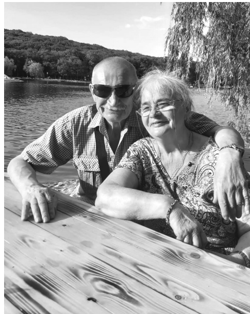
и очень любят гулять в городском парке. И всегда вместе, как в школьные беззаботные годы...