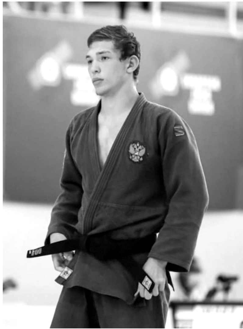
увлечение, чемпион желает обрести его и достигать успехов и развития.

Самой запоминающейся стала поездка в Испанию в прошлом году. Здесь он впервые выступил на Кубке Европы, и сама страна впечатлила спортсмена. Всем, кто еще не нашел любимое дело или