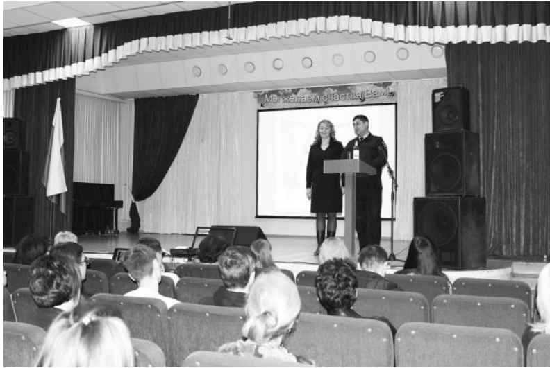
Татьяна ЛИДИНА, фото автора

Полицейские дали практические рекомендации по обеспечению информационной безопасности подростков в виртуальном пространстве, а после – ответили на вопросы участников встречи.