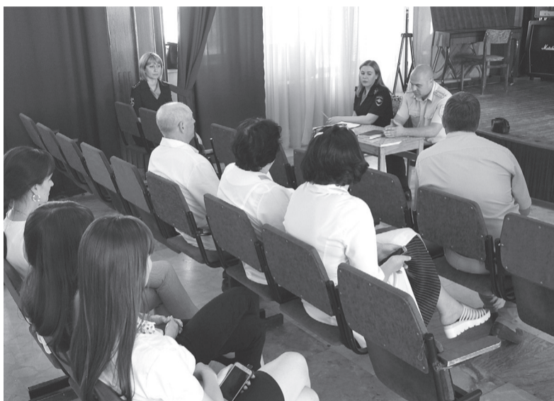
По материалам пресс-службы Отдела МВД России по городу Железноводску

После беседы подполковник полиции сообщил номера мобильных телефонов участковых, дежурной части и призвал граждан к бдительности и осторожности.