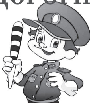
По материалам пресс-службы Отдела МВД России по городу Железноводску

Поучительными были и видеоролики, основанные на реальных событиях. Их «героями» стали нарушители ПДД.