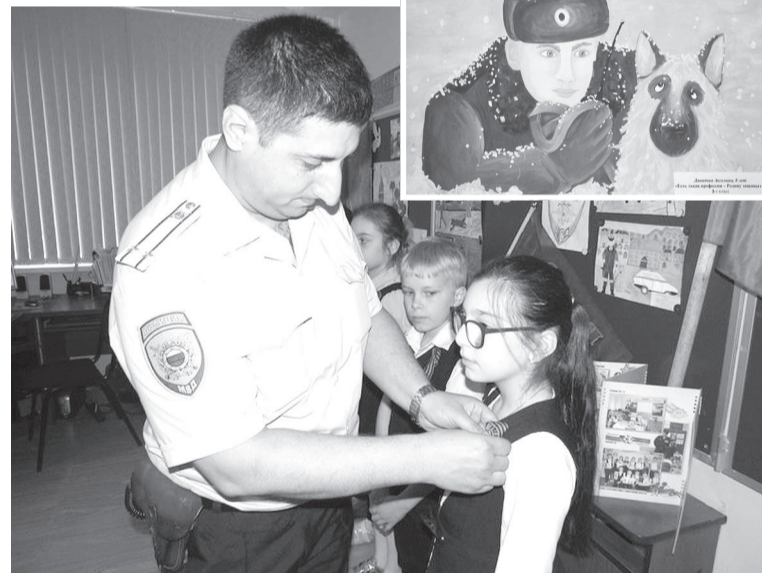
По материалам пресс-службы Отдела МВД России по городу Железноводску

Итоги конкурса рисунков сотрудников местного ОМВД и представители Общественного совета при полиции подведут накануне Международного дня защиты детей.