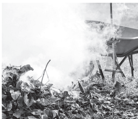
Отдел координации и контроля в сфере благоустройства администрации Железноводска

Несоблюдение требований, установленных Правилами благоустройства (№ 105-V от 28.07.2017 г.), влечет за собой применение мер административной ответственности к нарушителям в виде административных штрафов.