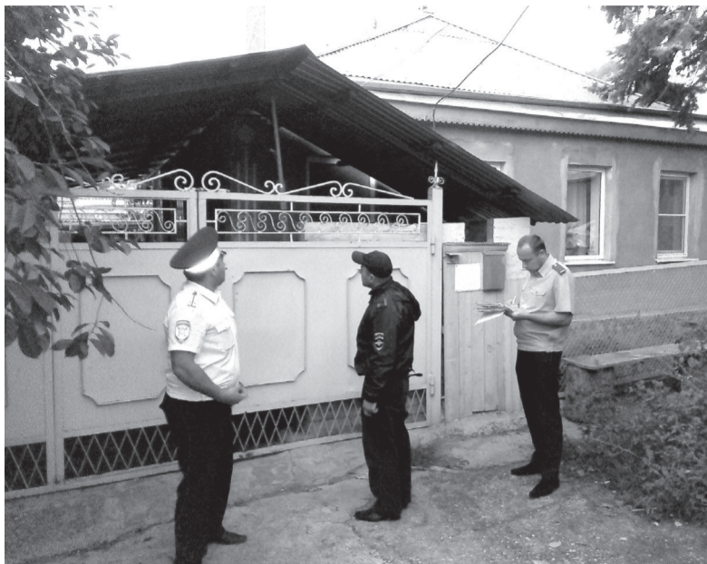
Отделение ГИБДД Отдела МВД России по городу Железноводску

Госавтоинспекция Железноводска напоминает о необходимости полной и своевременной оплаты наложенных административных штрафов. Проверить их наличие можно на портале gosuslugi.ru.