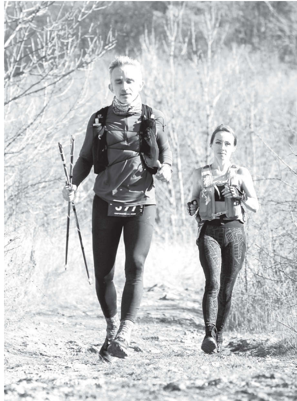
щего года. Регистрация на двухдневный марафон уже открыта.

Уже традиционный железноводский забег снова пройдет в городе-курорте в конце октября следу-