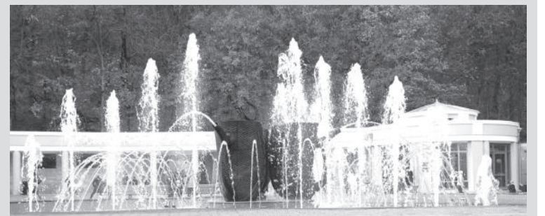
По материалам пресс-службы администрации Железноводска

Бронирование путевок на новогодние каникулы показывает динамичный рост. Железноводск продолжает набирать популярность как курорт выходного дня. Об этом свидетельствуют показатели «умных» счетчиков, фиксирующих расход минеральной воды в питьевых бюветах.